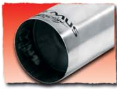
1x 90 mm Racing cut* 05RC