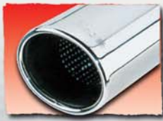
1x 97x80 mm 07 1x 82x67 mm 31 2x 82x67 mm 32