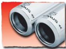
1x 84 mm Edition* 87 2x 84 mm Edition* 88