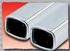
1x 80x65 mm 28 2x 80x65 mm 08