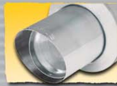
1x 98 mm Inox 98P