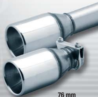
76 mm 90 mm 102 mm