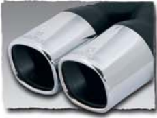
1x 92x78 mm 0000 01 2x 92x78 mm 0000 02