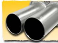
2x 90 mm Inox 96P