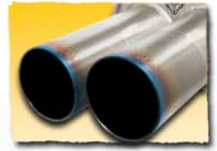
2x 90 mm Titan 96T