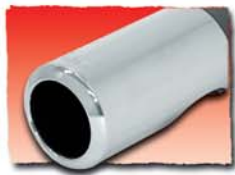
1x 76 mm Diesel 04D