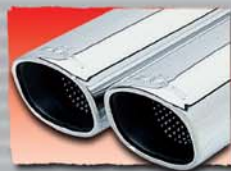
1x 92x78 mm angled 41 2x 92x78 mm angled 42