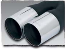
2x 76 mm cut 0000 04G