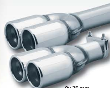
2x 76 mm