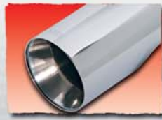
1x 90 mm cut/filter inset 05G