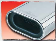
1x 135x75 mm 09 2x 135x75 mm 10