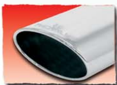
1x 138x90 mm 17