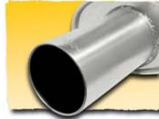
1x 90 mm Inox 95P