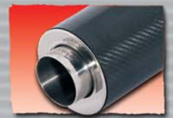
1x 110 mm Carbon 86