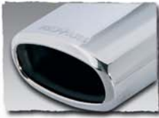
1x 142x72 mm 0000 14M