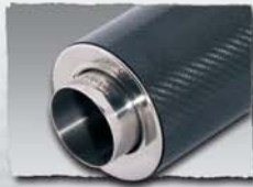
1x 110 mm Carbon 0000 86