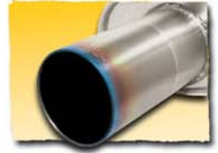
1x 90 mm Titan 95T