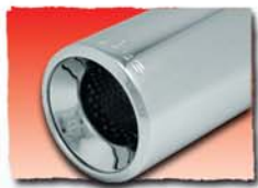
1x 127 mm 85