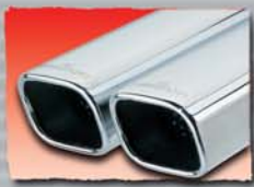
1x 74x65 mm angled 47 2x 74x65 mm angled 48