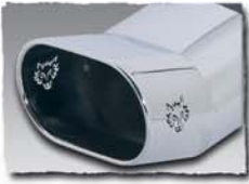
1x 135x75 mm* 0000 11