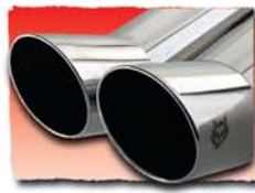
1x 76 mm Rallye DTM* 65 2x 76 mm Rallye DTM* 66 1x 84 mm Rallye DTM* 67 2x 84 mm Rallye DTM* 68