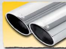
2x 84 mm angled 98P