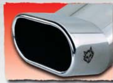
1x 135x75 mm Rallye DTM* 11