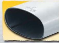
1x 140x72 mm Inox 90P