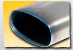
1x 140x72 mm Titan 90T