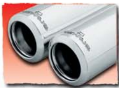
1x 84 mm Edition 77 2x 84 mm Edition 78