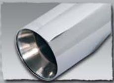
1x 90 mm cut/filter inset 1000 05G