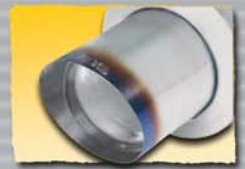
1x 98 mm Burned 98B