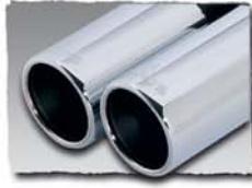
2x 76 mm 0003 04