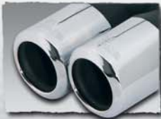
2x 84 mm 0000 78