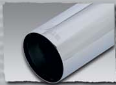
1x 90 mm cut 0000 05G