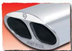
1x 150x85 mm Twin Stream 16