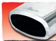
1x 142x72 mm 14M 1x 142x72 mm double angled** 14SS