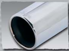
1x 102 mm 0000 70