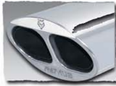
1x 150x85 mm Twin-Stream 0000 16