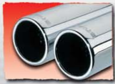
1x 76 mm 03 2x 76 mm 04 1x 90 mm 05 2x 90 mm 06 1x 102 mm 70 2x 102 mm 72 1x 115 mm 80