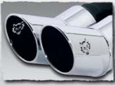
2x 76 mm Rallye-Design* 0000 66