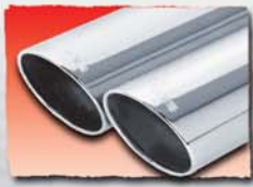
1x 84 mm angled 55 2x 84 mm angled 56