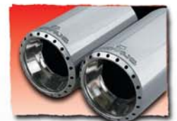
1x 76 mm Turbo Design 03TD 1x 84 mm Turbo Design 87TD 2x 84 mm Turbo Design 88TD 1x 102 mm Turbo Design 70TD 2x 102 mm Turbo Design 72TD 1x 115 mm Turbo Design 80TD