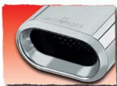
1x 135x75 mm 09M