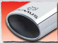
1x 120x74 mm* 12