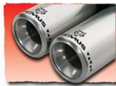
1x 76 mm Future Design* 03F 2x 76 mm Future Design* 04F 2x 102 mm Future Design* 70F 2x 102 mm Future Design* 72F