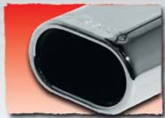
1x 102x68 mm 33 2x 102x68 mm 34