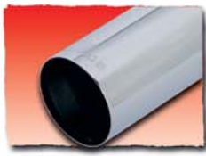
1x 90 mm cut 56