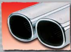
1x 92x78 mm 01 2x 92x78 mm 02