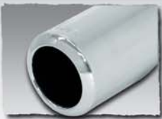
1x 84 mm 1000 77